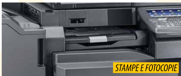
STAMPE E FOTOCOPIE