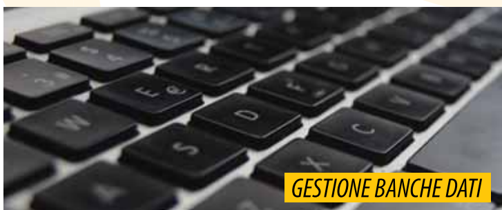
GESTIONE BANCHE DATI