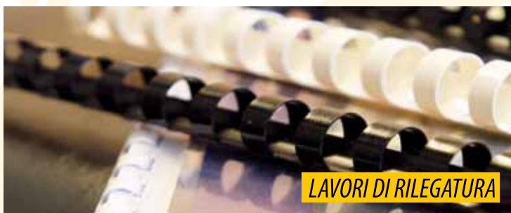
LAVORI DI RILEGATURA